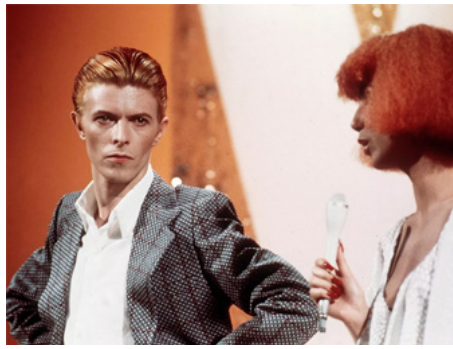
1976 L'HOMME QUI VENAIT D'AILLEURS (The Man who fell to Earth) de Nicolas Roeg