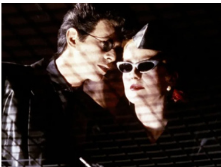
1983 LES PRÉDATEURS (The Hunger) de Tony Scott avec Catherine Deneuve