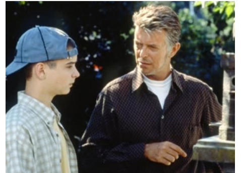
1999 LE SECRET DE M. RICE (Mr Rice's Secret) de Nicholas Kendall avec Bill Switzer