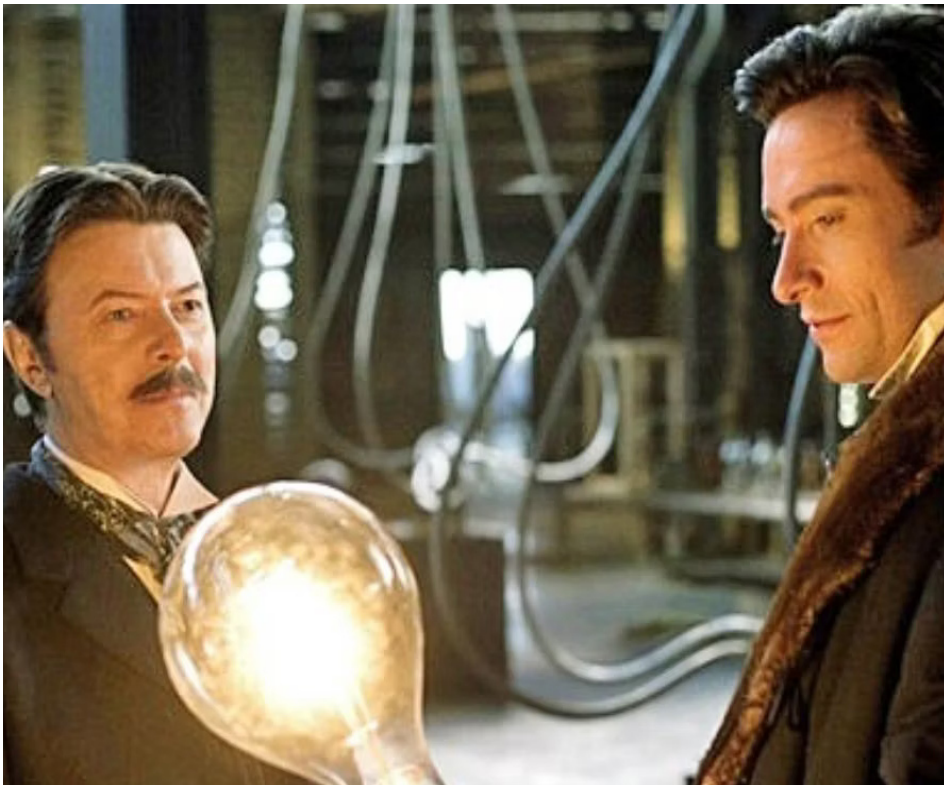
2006 LE PRESTIGE (The Prestige) de Christopher Nolan avec Hugh Jackman