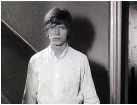
1969 L'IMAGE (The Image) de Michael Armstrong