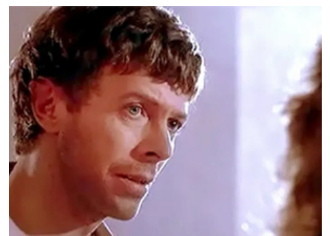
1988 LA DERNIÈRE TENTATION DU CHRIST (The Last Temptation of Christ) de Martin Scorsese