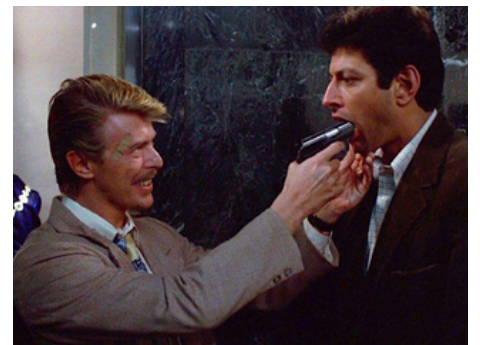
1985 SÉRIE NOIRE POUR UNE NUIT BLANCHE (Into the Night) de John Landis avec Jeff Goldblum