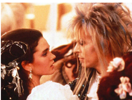
1986 LABYRINTHE (Labyrinth) de Jim Hanson avec Jennifer Connelly