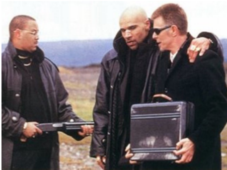
1998 G-MEN (Everybody loves Sunshine) d'Andrew Goth avec Goldie