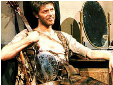
1982 BAAL (Baal) d'Alan Clarke