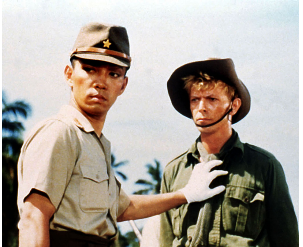
1983 FURYO (Senjo no Merry Christmas) de Nagisa Oshima avec Ryuichi Sakamoto