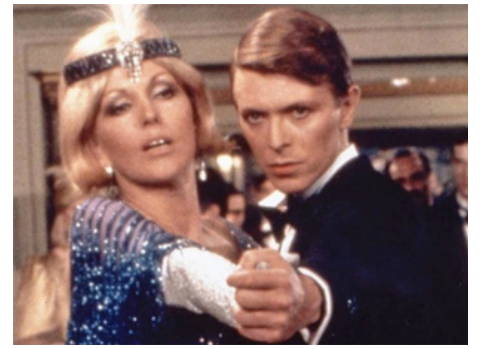
1978 C'EST MON GIGOLO (Schöner Gigolo, armer Gigolo) de David Hemmings avec Kim Novak