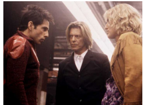
2000 ZOOLANDER (Zoolander) de Ben Stiller avec Ben Stiller, Owen Wilson