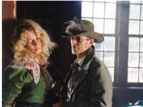
1998 IL MIO WEST (Il Mio West) de Giovanni Veronesi avec Alessia Marcuzzi