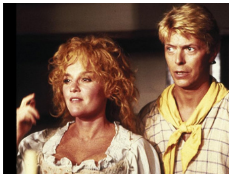
1983 BARBE-D'OR ET LES PIRATES (Yellowbeard) de Mel Damski avec Madeline Kahn