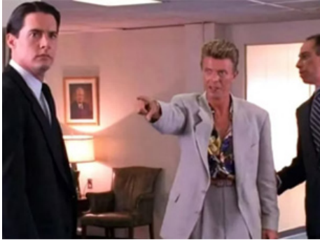
1992 TWIN PEAKS : FIRE WALK WITH ME de David Lynch avec Kyle MacLachlan